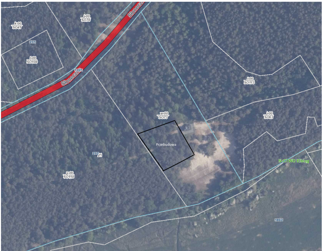
Ryc. 1. Miejsce wskazane do przebudowy.